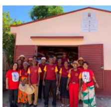
MEMBRI DEL CONSORZIO