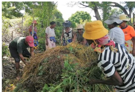
PREPARAZIONE DEL COMPOST