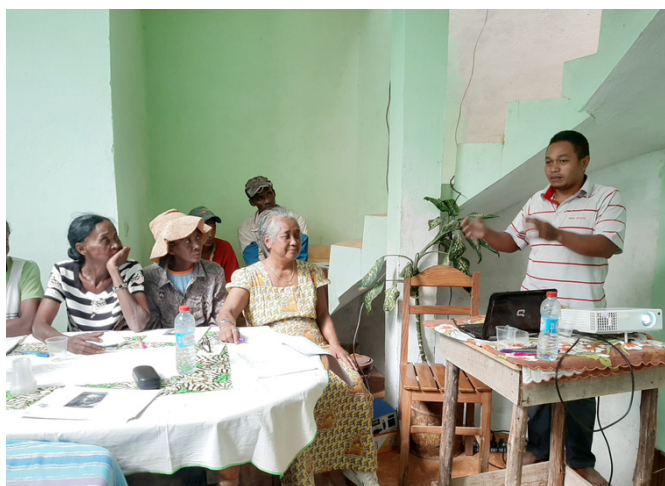
formazione soci cooperativa in aula