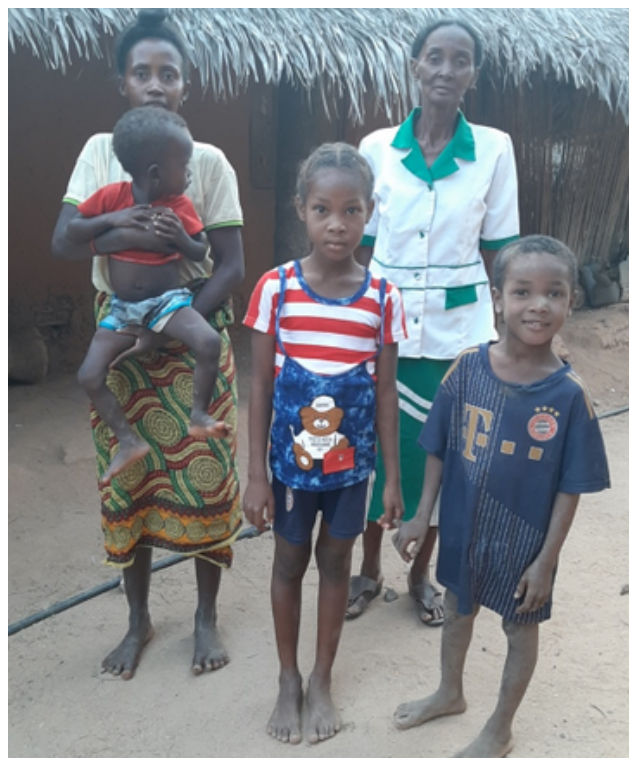
membri della Cooperativa con figli

Infine l' epidemia aviaria nella regione ha comportato la perdita di parte dei pulcini acquistati e quindi ulteriori ritardi nella realizzazione della fase finale di accrescimento e vendita dei polli