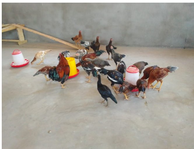
pollastri di circa 3 mesi