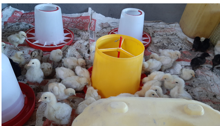
pulcini inizio allevamento