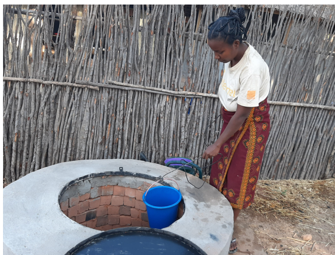
pozzo in funzione

Ottobre: attualmente la crescita dei polli procede regolarmente e se ne prevede la vendita nella seconda metà di novembre. Inoltre entro l’inizio di novembre è previsto l’ acquisto di altri 100 pulcini che saranno allevati e venduti nei primi mesi del 2023.